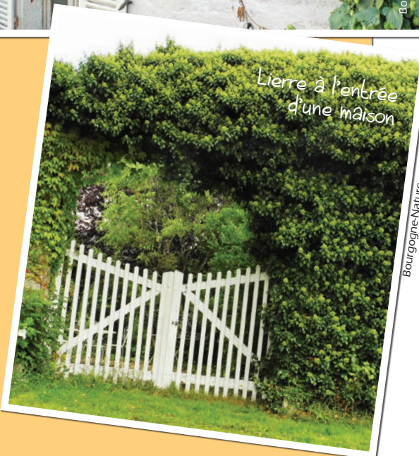
Lierre à l'entrée d'une maison