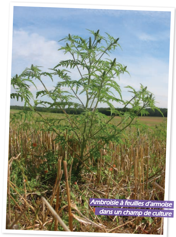
Ambrosie à feuilles d'armoise dans un champ de culture

CE SONT LES HUMAINS QUI À TRAVERS LEURS NOMBREUX VOYAGES ONT TRANSPORTÉ LES GRAINES DE CETTE AMBROISIE SUR PRATIQUÈMENT TOUTE LA PLANÈTE.