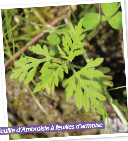
Feuille d'Ambrosie à feuilles d'armoise

breux voyages, ont transporté souvent sans le faire exprès, les graines de cette ambrosie sur pratiquement toute la planète. Les ambrosies arrivées en France ont trouvé ici de parfaites conditions pour se développer et former à leur tour de nouvelles graines. Petit à petit, l'ambrosie a colonisé une grande partie de la France et envahi de nombreuses zones où elle est devenue gênante. On la qualifie alors d'espèce exotique envahissante.