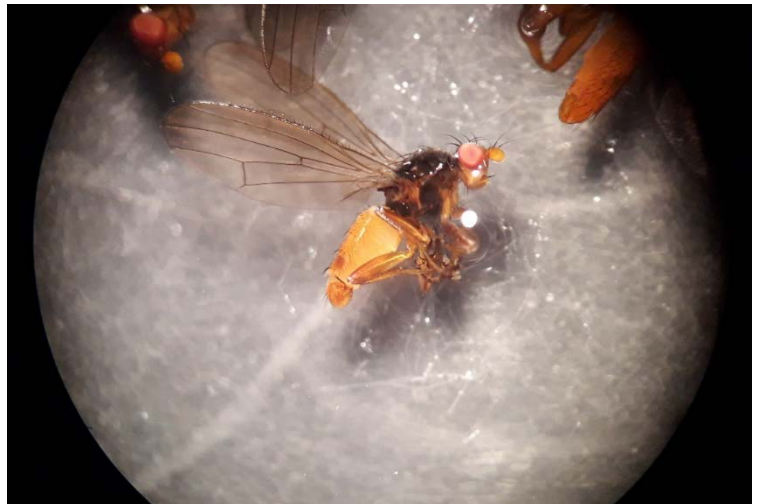
" Neoleria in scripta (Diptera Heleomyzidae), sous binoculaire. Ce spécimen marchait le 25 novembre 2019 sur les derniers restes de cuir"

Fin janvier 2019, un âne du troupeau du Conservatoire des espaces naturels de Franche-Comté, dédié à la gestion de la Réserve naturelle nationale du ravin de Valbois, s'est écroulé à presque 31 ans. Le gestionnaire a décidé, en accord avec les services de l'Etat concernés, de laisser le cadavre se dégrader naturellement. Un suivi scientifique a été organisé. Un piège photographique a été installé et des chasses au filet effectuées de février à décembre 2019. Parmi les diptères identifiés, on note la présence d'un mâle de Nemopodaspeiseri , nouvelle mention française, associée à des cadavres de moyenne à grande taille.